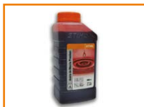
Aceite de mezcla STIHL