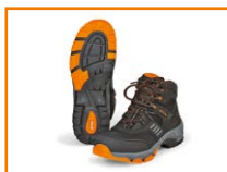
Zapatos de seguridad STIHL