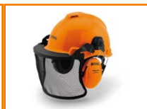
Casco de seguridad STIHL